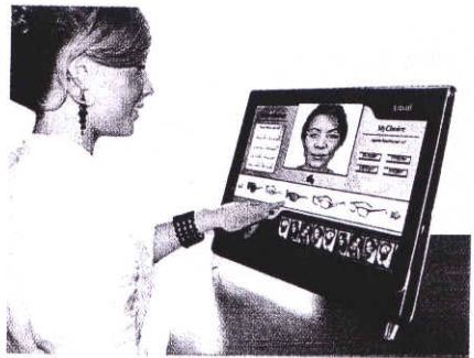
L'écran tactile se place sur la table de vente pour un essai autonome ou accompagné

Les plus : création d'un album photo pour revoir les modèles précédents, un outil malin pour réduire les stocks en magasin. Distribution : EBC Médical.